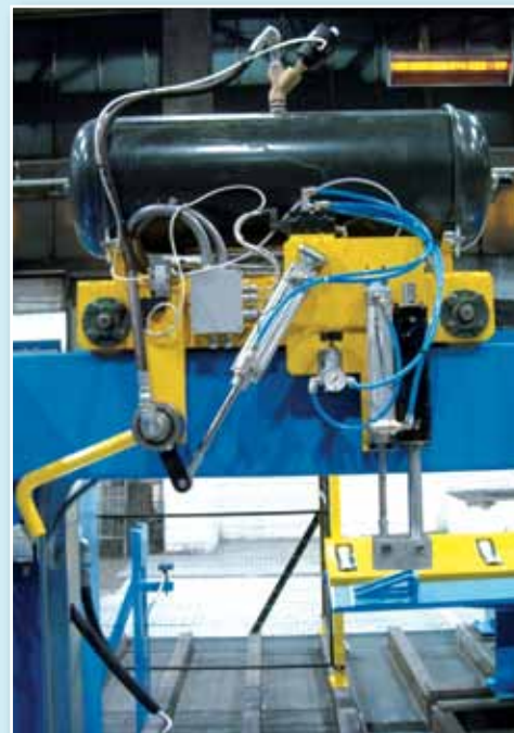
Soffiatore trucioli Shavings blower