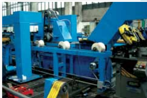
Tranciasfrido con nastro trasportatore Scrap cutter with conveyor belt

It can operate autonomously with no need for an operator, is very flexible and integrates perfectly with the tube production line. It also interfaces perfectly with the customer's cutting device, adjusting itself automatically.