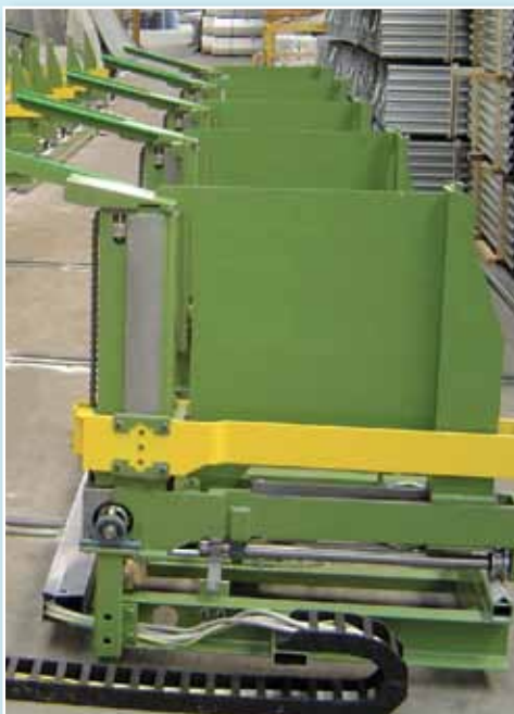
Supporto con paratia di separazione Support with dividing wall

Grazie alla duttilità del progetto è possibile adattare l'impianto alle diverse gamme produttive, realizzando pacchi quadrati per tubi tondi, quadrati e rettangoli. Ogni impianto è formato da due ceste, così da ridurre i tempi morti; mentre una è posizionata fuori linea per consentire la reggiatura ed il prelievo del pacco, l'altra si trova sotto lo scarico e procede automaticamente alla formazione del nuovo pacco. Nel caso di produzione di spezzoni di tubi di lunghezza ridotta è possibile realizzare simultaneamente più pacchi per ogni cesta, semplicemente inserendo una paratia di separazione per ogni supporto: questo rende le ceste particolarmente adatte a ricevere tubi direttamente da linee di taglio a teste multiple.