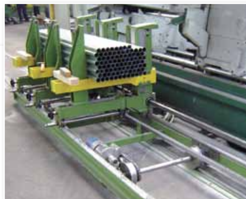
Cesta di raccolta Collecting tubes basket

The plant is fast to install with no need for much factory floor modification. Translating baskets can be positioned parallel to the tube outlet or in a hybrid manner with one perpendicular and the other parallel, exploiting factory production spaces to the utmost.