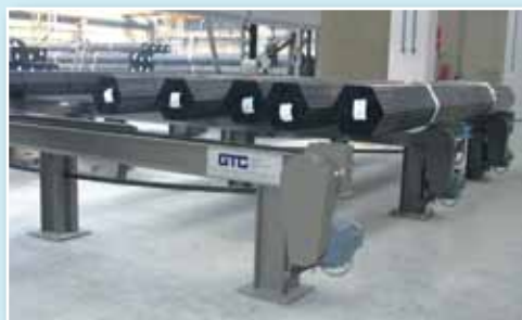
Panoramica dell'impianto View of the plant