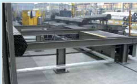
Catenarie di stoccaggio Chain storage

L'impianto è stato studiato per essere abbinato ad una linea di impacchettamento esistente, oppure come semplice sistema di traslazione per lo stoccaggio o le successive lavorazioni fuori linea richieste.