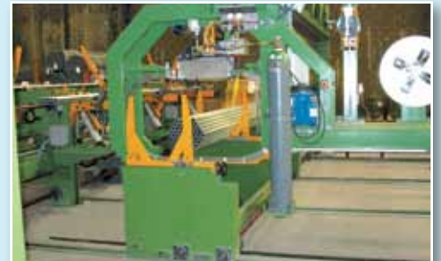
Carrello a sfilaggio frontale Front withdrawal carriage