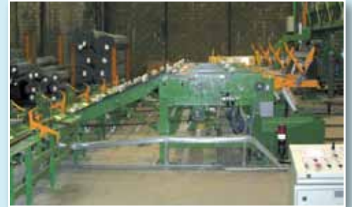
Impianto completo Complete plant

This plant can be customised by adding stations; in particular, draining, blowing, weighing and storage of packs based on single customer needs.